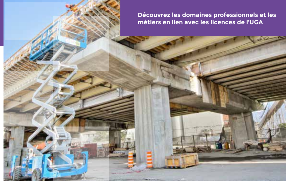
Poursuite d'études en master, par secteurs professionnels, avec une licence génie civil obtenue en 2017 et 2018

Découvrez les domaines professionnels et les métiers en lien avec les licences de l'UGA